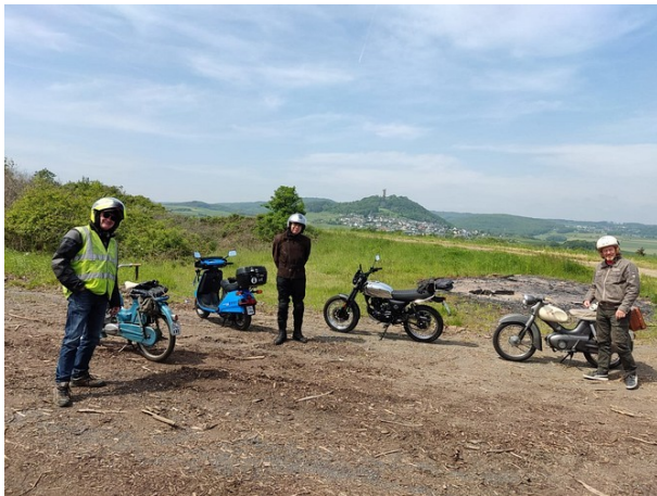
Osteifel-Tour für Mopeds 2023

Motorrad-Veteranen-Rallye in Euskirchen-Dom Esch