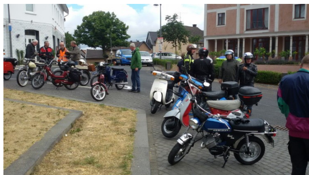
3-PS-Tour im Sommer 2017