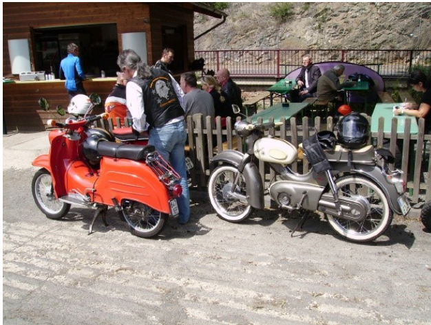
Ausklang einer Tour